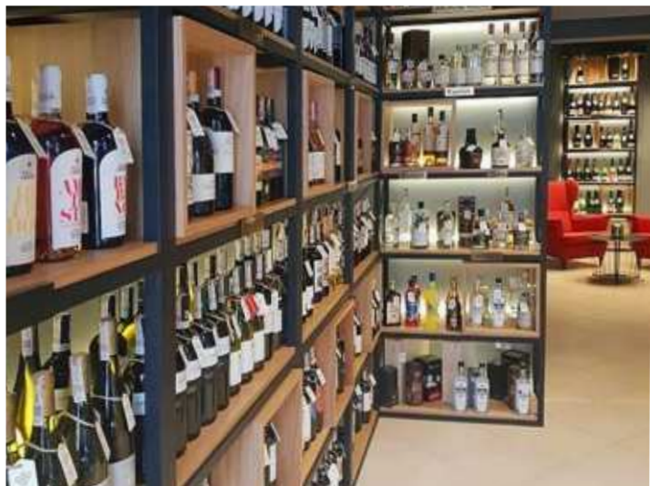
Serie BLACK PURE Professional